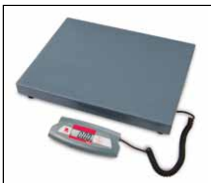
Modely s kapacitou 75kg a 200kg jsou dostupné také s velkou vážicí plošinou